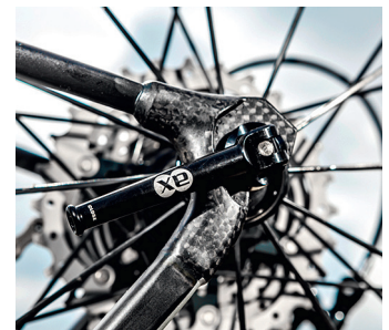
Bis hin zu den eingeklebten Ausfallenden: Rahmen und Parts werden in Deutschland hergestellt.