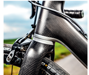
1042 Gramm wiegen Rahmen, Gabel, Steuersatz und Beschläge des Vial Evo – ein neuer Bestwert.